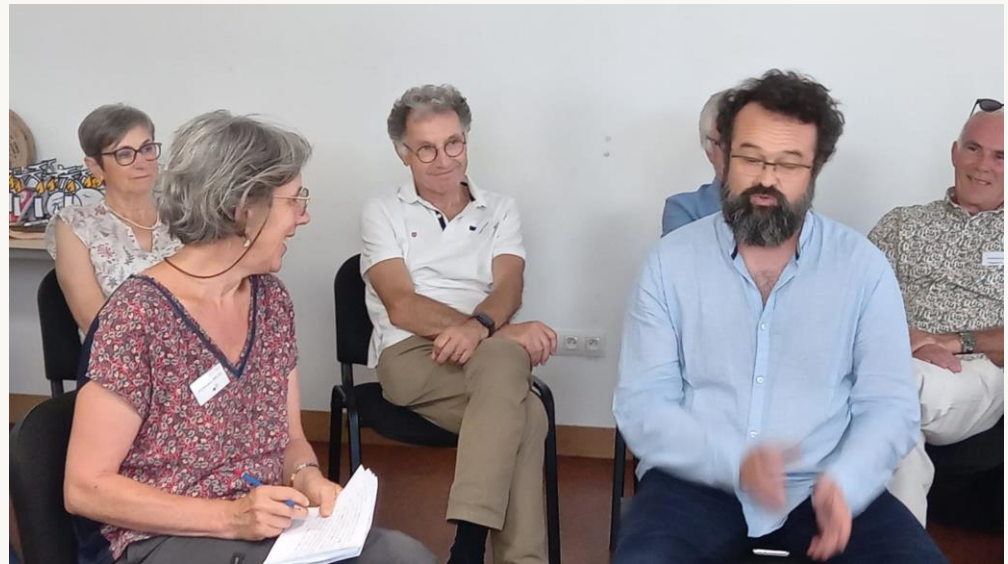
La table ronde avec les coopérateurs et les entrepreneurs samedi après-midi