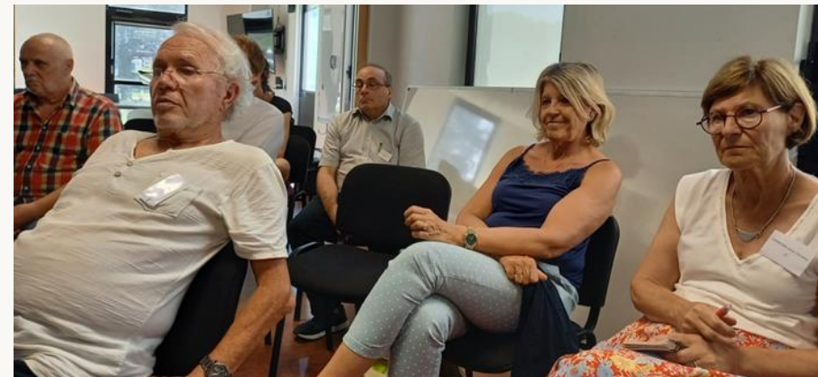
La table ronde avec les coopérateurs et les entrepreneurs samedi après-midi