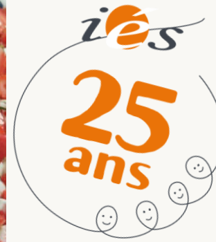
Le gâteau d'anniversaire !