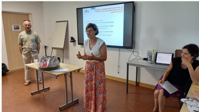
Des prises de paroles et témoignages pendant l'AGO