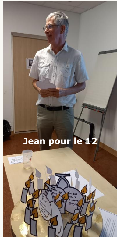
Jean pour le 12