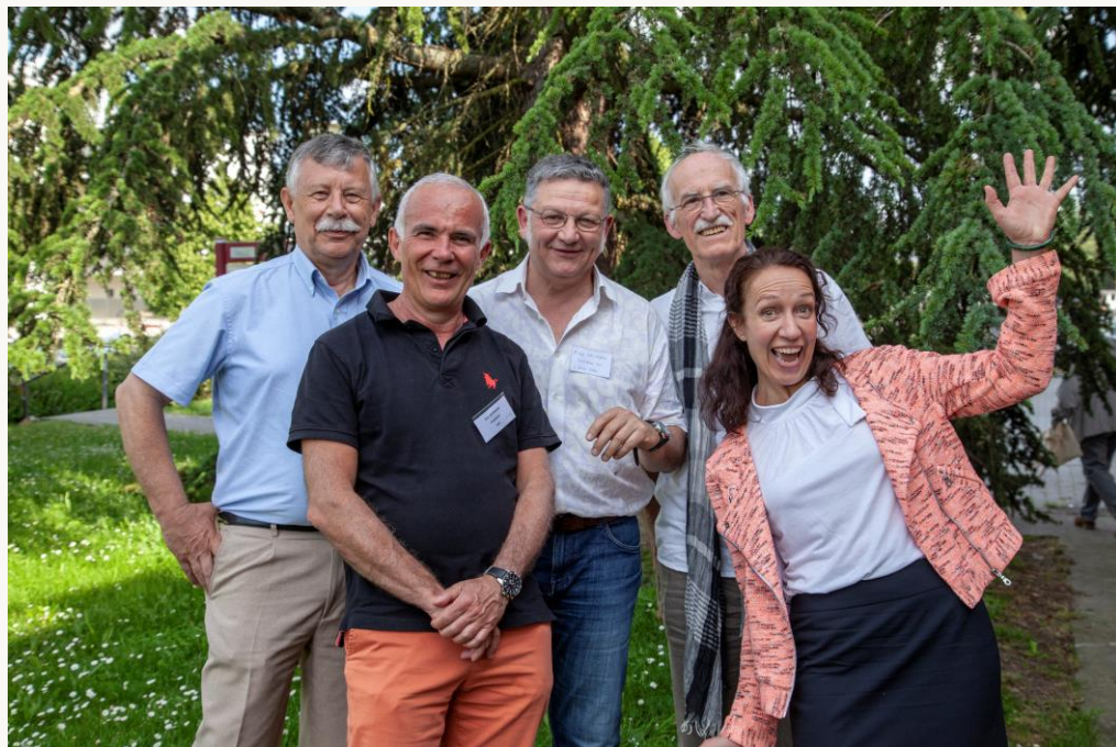
Ceux qui ont été président.e.s d'IÉS et Eric qui l'est actuellement ! Photo prise pour les 20 ans.