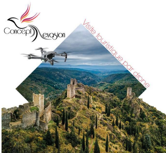
L'immersion dans la peau d'un oiseau

74 avenue Paul Sabatier 11000 NARBONNE 07 67 17 10 61 info@conceptevasion.com http://www.conceptevasion.com/