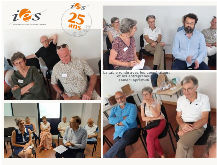
Un extrait du rendu de la table ronde du 24 juin 2023 !